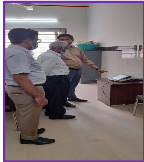
गदग आयुर्विज्ञान संस्थान, गदग, कर्नाटक में चिकित्सीय उपकरण का निरीक्षण