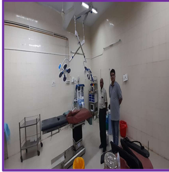
सरकारी ज़िला अस्पताल, बागलकोट, कर्नाटक में चिकित्सीय उपकरण का निरीक्षण